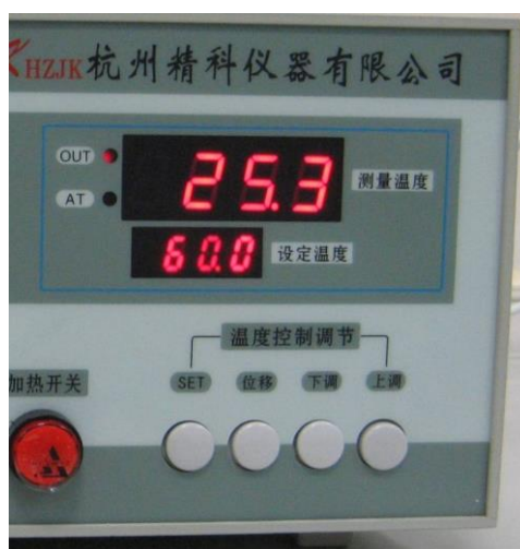
图 3 PID 温度控制器面板布置图